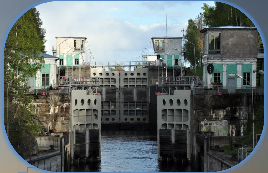
ББК, шлюз № 10