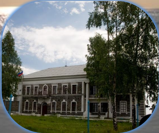
Штаб строительства ББК в Надвоицах